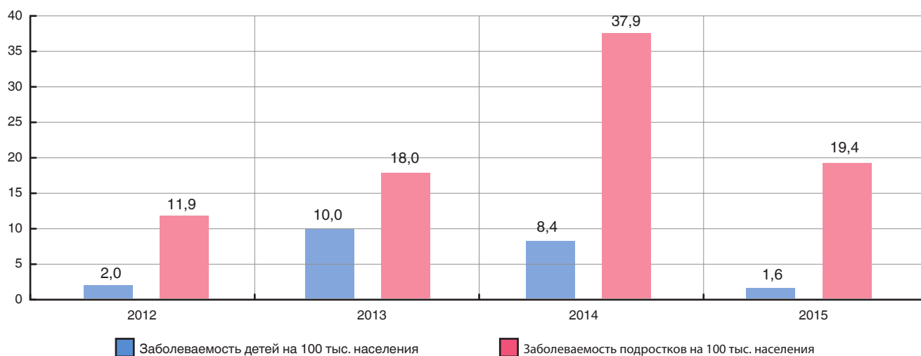
Рис. 1. Заболеваемость детей и подростков г. Ставрополя в 2012-2015 гг.